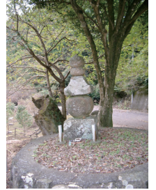
犬塚五輪塔 (市指定有形文化財)