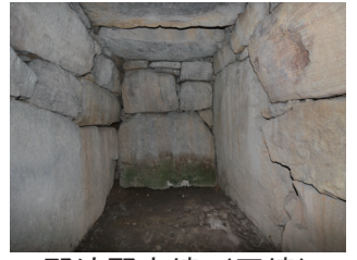
那波野古墳(円墳) (県指定史跡)