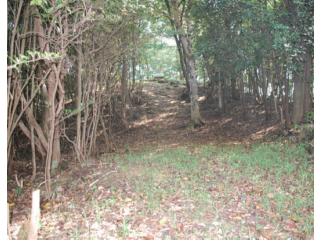
宿禰塚古墳と採集須恵器 (市指定史跡)