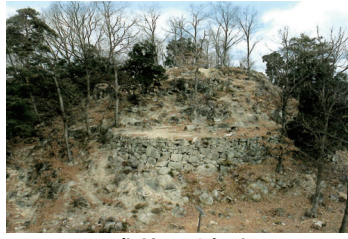
感状山城跡 (国指定史跡)