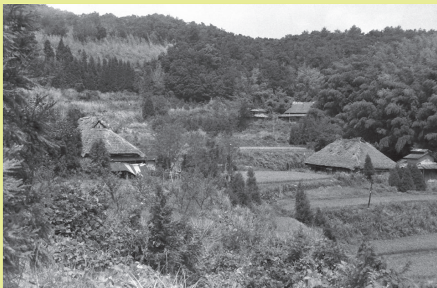
ありし日の三濃山西谷集落（1970年）