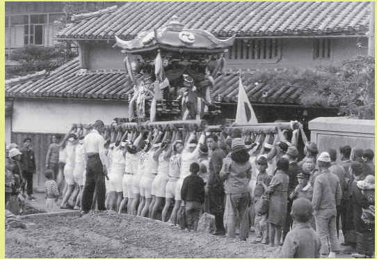
相生上町の屋台練り（1930年頃）