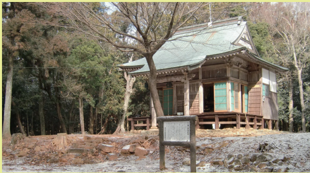
三濃山求福教寺観音堂